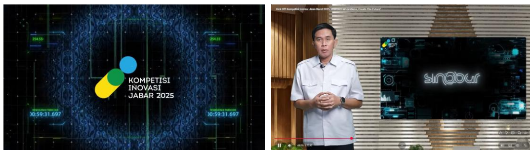
Gambar 1. Kick Off KIJB melalui Live Youtube