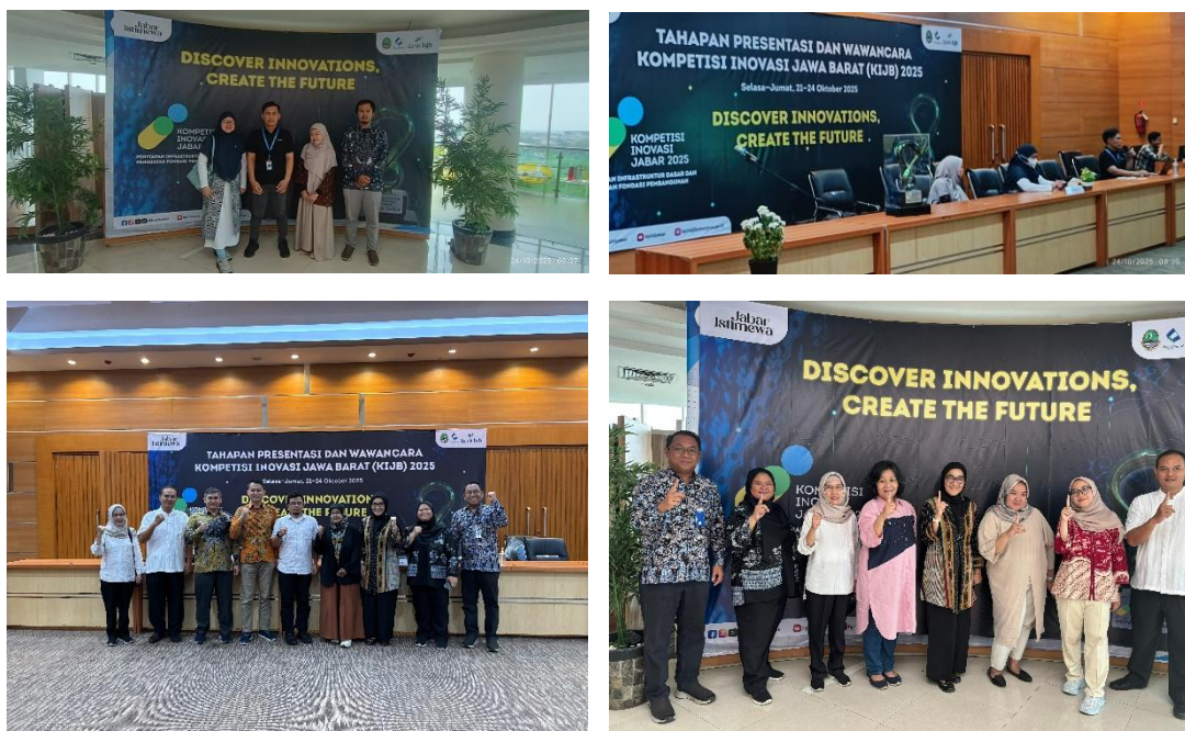
Gambar 3. Tahap Presentasi Top 30 KIJB 2025

Partisipasi dalam Kompetisi Inovasi Jawa Barat (KIJB) Tahun 2025 merupakan manifestasi nyata dari komitmen Bapperida Kota Bogor untuk terus mendorong budaya inovasi di lingkungan birokrasi dan masyarakat. Proses yang telah dilalui, mulai dari persiapan, penjurian, hingga masuk dalam Top 30 finalis, adalah sebuah pengalaman berharga yang memperkaya wawasan serta jejaring inovasi kami.