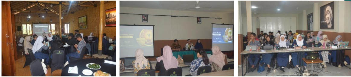
Gambar 2. Coaching Clinic Kompetisi Inovasi Jawa Barat